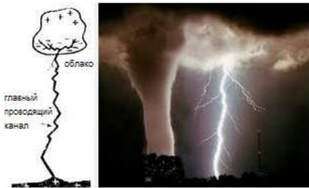
Рис. 2. Торнадо: разделение зарядов между облаком и землей, торнадо, молния.