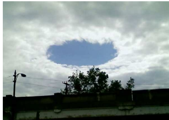
Рис. 3. Дыра в облаке.

облако. У нас есть все основания предположить, что в столбе торнадо происходят явления, аналогичные тем, о которых речь шла выше.