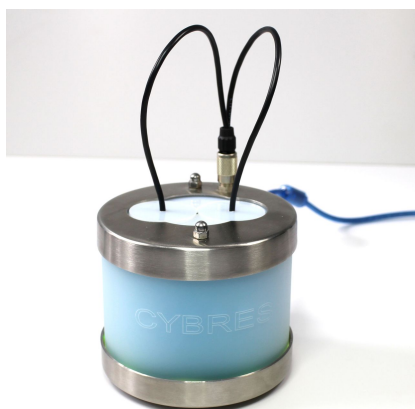
Рис. 1. CYBRES MU EIS импедансный спектрометр.

Встроенная термостатическая система использует двух канальный цифровой ПИД-регулятор с несколькими датчиками температуры. MU EIS термостабилизирована на уровне печатных плат. Система оснащена 3D акселерометром/магнитометром, часами реального времени, измерителем мощности ЭМ фона (опционально), влажности/давления (опционально) и датчиками напряжения для мониторинга состояния окружающей среды во время длительных экспериментов. USB интерфейс используется для передачи данных и для питания устройства. Цифровые линии имеют гальваническую развязку. Все данные записываются в режиме реального времени и могут быть сохранены во флэш-памяти с метками времени.