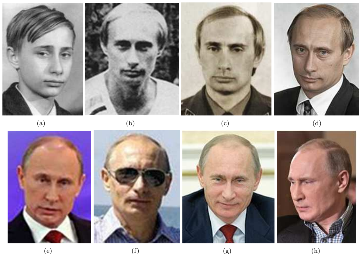
Рис. 1. Фотопортреты В.В.Путина в разные возрастные периоды и при разном типе деятельности. а - ребёнок (8-14 лет), б - юноша (18-23 года), с - офицер КГБ (33-38 лет), д - руководитель ФСБ (46 лет), е - президент 1-го срока (48-52 года), ф - премьер-министр (56-60 лет), г - президент 3-го срока (60-66 лет), h - в церкви на богослужении (66 лет).