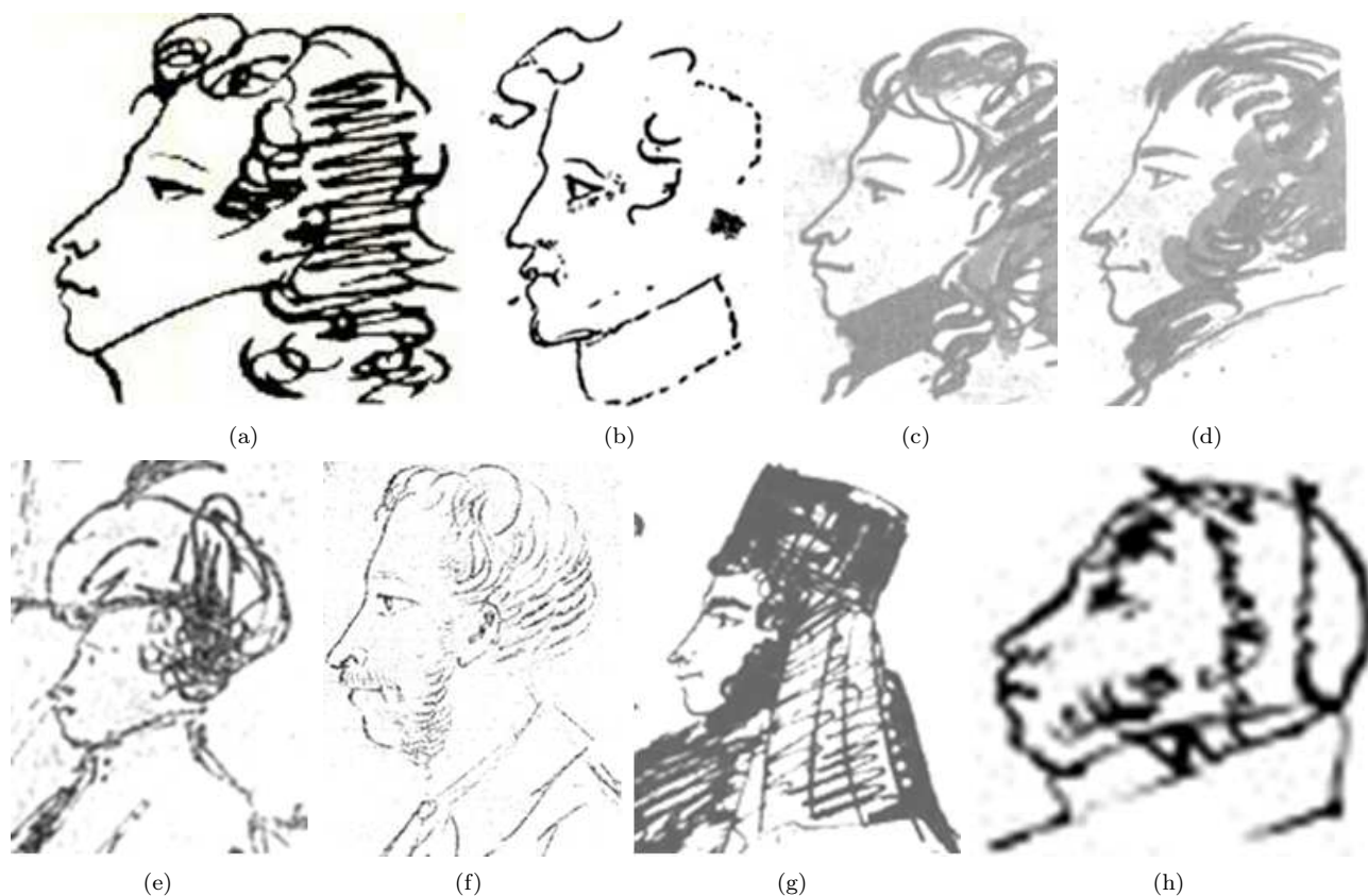
Рис. 5. II-я серия фотографий рисунков-автопортретов Пушкина в образе других личностей а – поэт, b – лицеист, с – юноша, d – взрослый, e – дворцовый скороход, f – заключённый в карантине, g – монах перед бесом, h – обрюзгший старик.