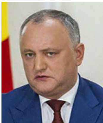
Рис. 3. Фотопортрет Додона.