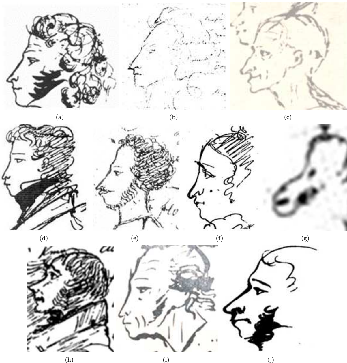
Рис. 4. I-я серия фотографий рисунков-автопортретов Пушкина в образе других личностей а – Поэт, б – Робеспьер, с – Вольтер, d – Байрон, е – приговорённый к эшафоту, f – женщина, g – лошадь, h – безумец, i – измождённый старик, j – последний автопортрет.